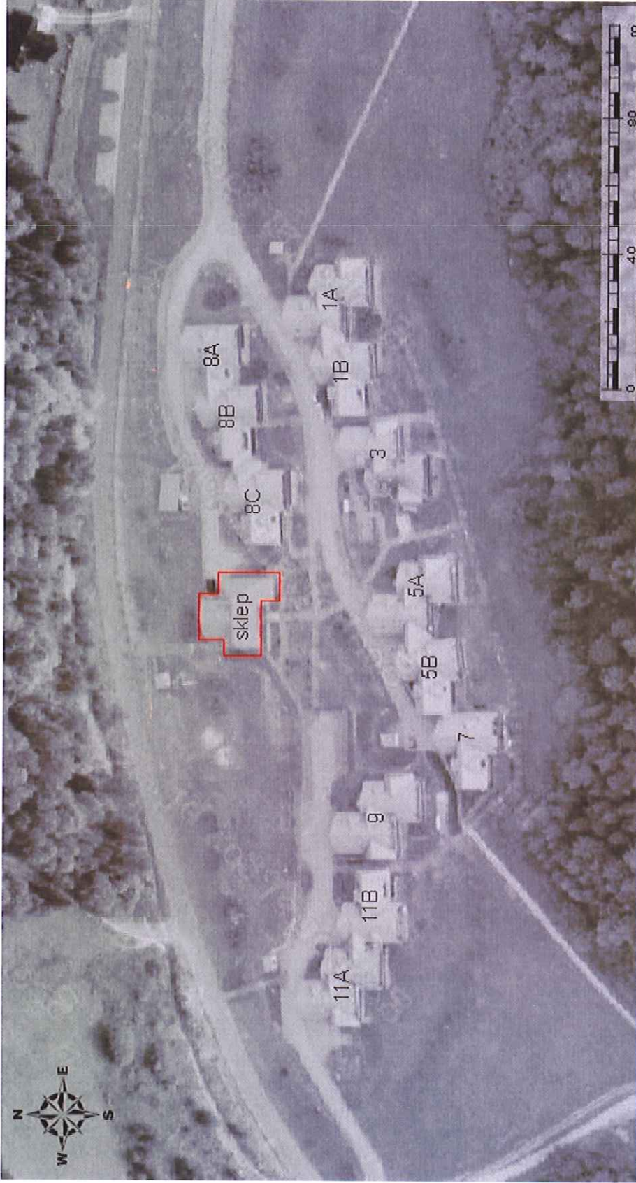
Osiedle Pod Taborem - lokalizacja pralni (sklepu)